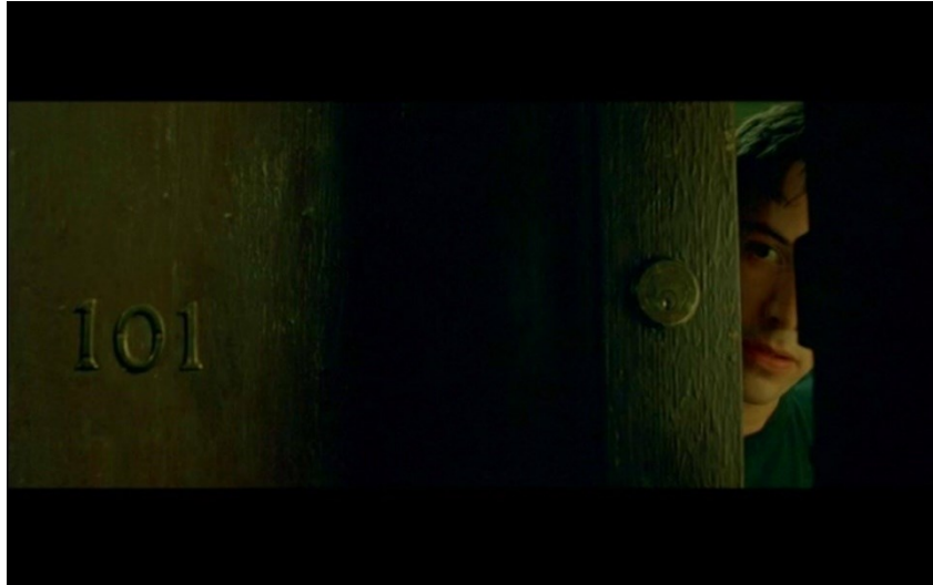
Tür 101 im Film „Matrix“