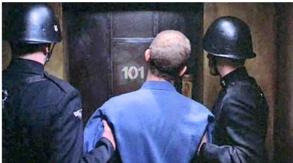
Tür 101 im Film „1984“