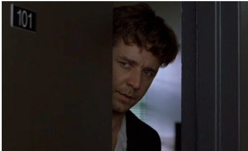
Tür 101 im Film „A Beautiful Mind“

Natürlich hat das alles überhaupt nichts zu bedeuten. Warum auch? Was für eine Rolle spielt diese geheimnisvolle Tür 101 , wenn sie ausgerechnet in diesen drei Filmen so unauffällig und doch bedeutungsvoll erwähnt und gezeigt wird? In allen drei Filmen geht es um die Gefangenschaft der Menschheit in einem Irrtum, und doch hat das keine Bedeutung?